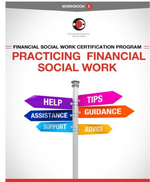
Kuva: Center for Social Work, Workbook 5 Cover